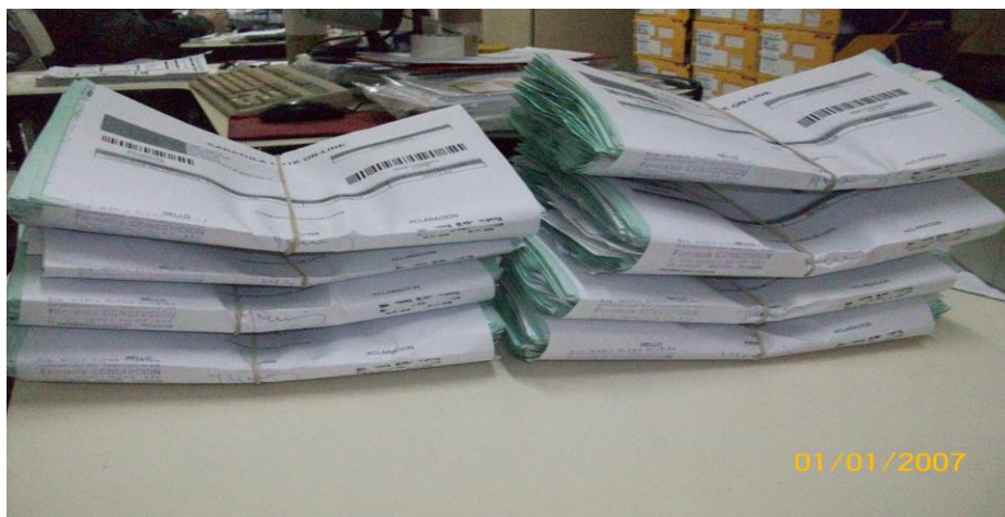
IMAGEN Nro 5

Realizar la misma operación con todos los lotes como la imagen lo indica.